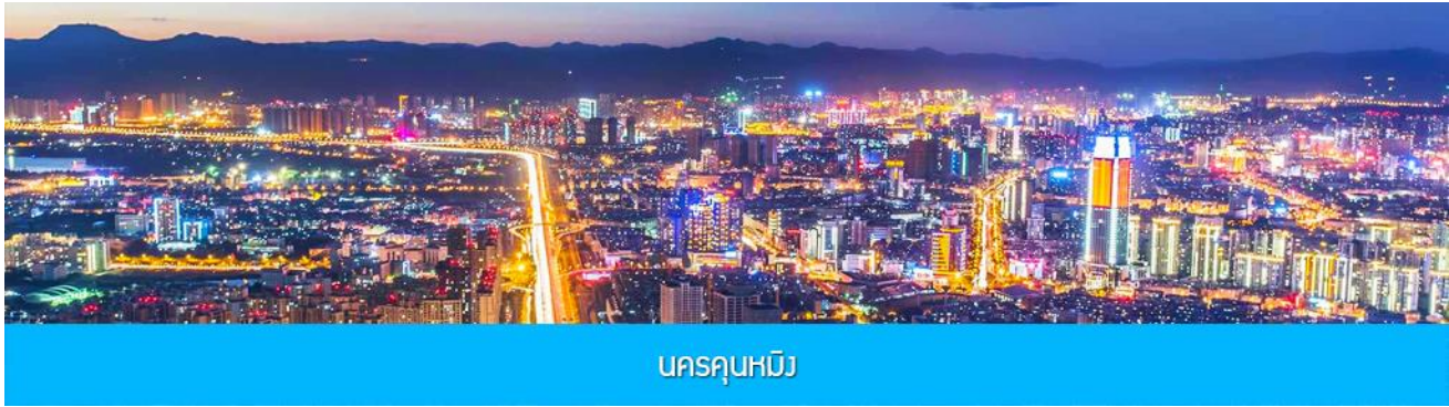
นครคุนหมิง