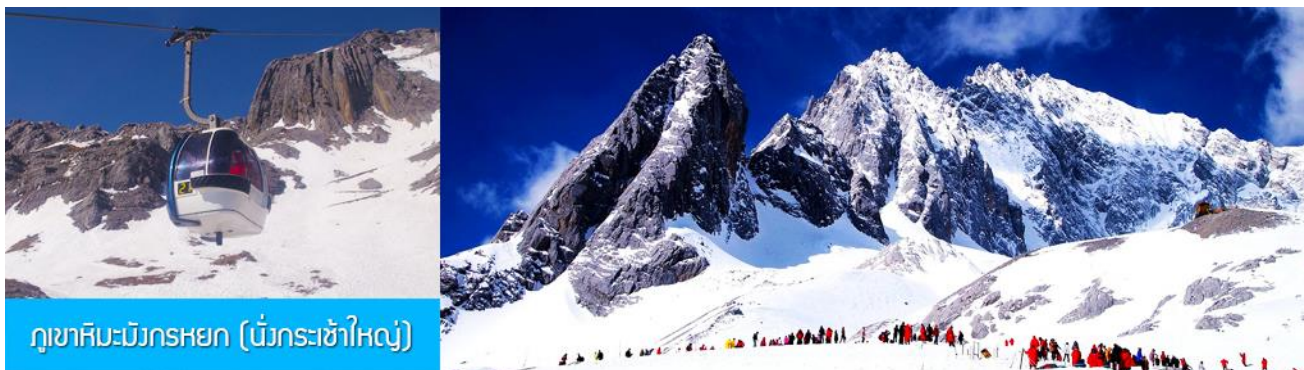
ภูเขาหิมะมังกรหยก (มังกรกระซำใหญ่)

พักที่ FENGHUNG YANGSHENG HOTEL ระดับ 4 ดาวท้องถิ่นหรือเทียบเท่าใน เมืองลี่เจียง