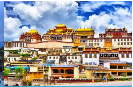
เมืองเซงกริลล่า

วันที่สอง เมืองโบราณต้าหลี่-วัดเจ้าแม่กวนอิมเปลงกาย- ผ่านชมเจดีย์สามองค์- เดินทางสู่เมืองเซงกริลล่า- เมืองโบราณเซงกริลล่า