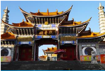
วัดเจ้าแม่กวนอิมเปลงกาย

พักที่ REGENT HOTEL โรงแรมระดับ 4 ดาวท้องถิ่น หรือเทียบเท่าในเมืองต้าหลี่