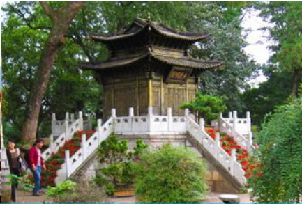
ตำหนักกวงจินเตี้ย