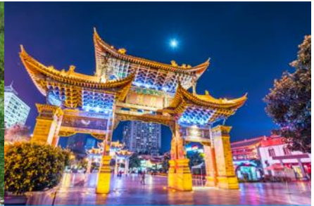
ถนนคนเดินหนานผิงเจีย

วันที่ห้า เมืองลี่เจียง – บั้งรถไฟความเร็วสูงสู่นครคุนหมิง – ตำหนักทอง – ซุปปิ้งย่านนานผิงเจีย-เดินทางกลับกรุงเทพฯ