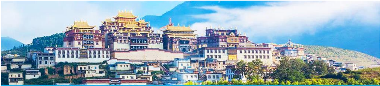
เมืองโบราณเซกริลา