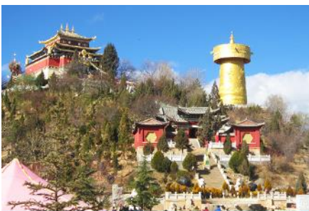
วัดลามะชวงจ้านหลิง

พักที่ SHU JIN MU YUN HOTEL ระดับ 4 ดาวท้องถิ่นหรือเทียบเท่าใน เมืองเซกริลา