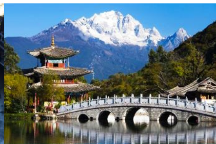
สะพานมังกรดำ